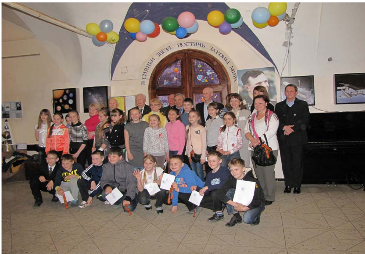
Учащиеся школ №16 и №39 города Владимира, работники Владимирского планетария и члены Владимирской организации ветеранов космодрома Байконур.