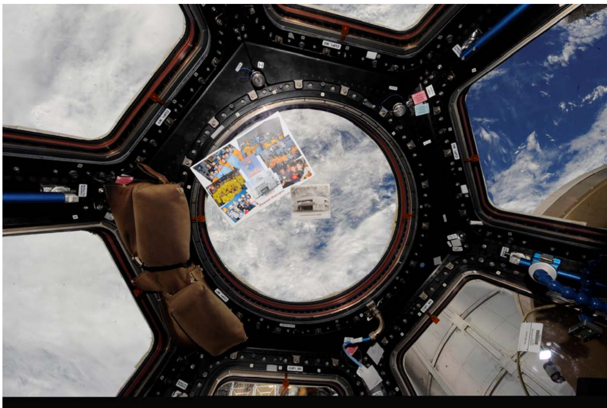
Фотографии Нижегородского планетария и его детского кружка «Притяжение» на МКС.